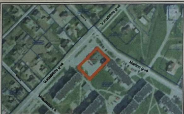
NAGRINĖJAMO SKLYPO VIETA SITUACIJOS SCHEMA